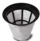
Kit filtre 3240 (FTDP28733)