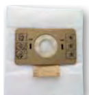
Pochette de 10 sacs microfibre SA 10