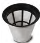
Kit filtre 3833 (FTDP00226)