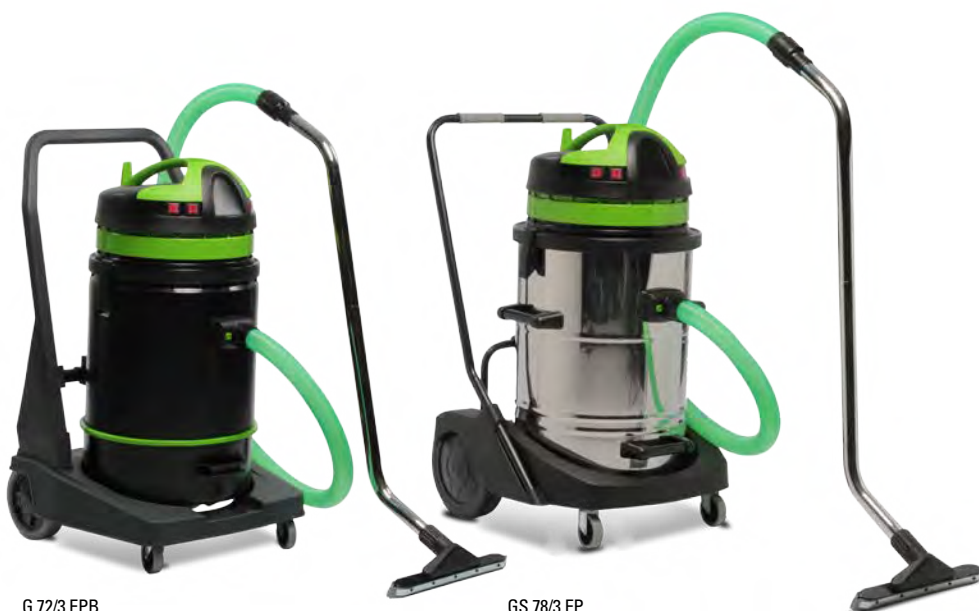
G 72/3 EPB